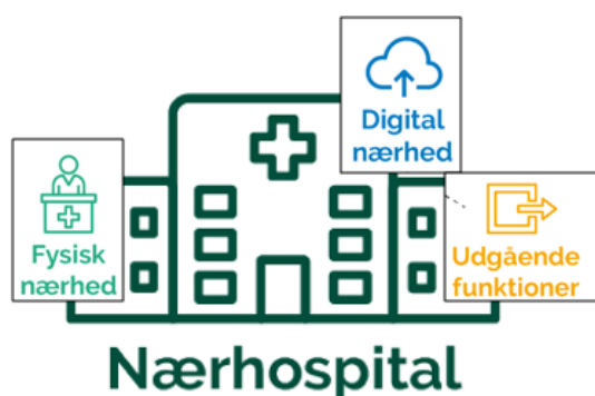
Figur 1: Nærhospitalets tre centrale veje til nærhed og tilgængelighed i indsatsen

I et nærhospital er der tale om sundhedstilbud, hvor læger, sygeplejersker og øvrige faggrupper på tværs af sektorer varetager indsatser enten ved fysisk tilstedeværelse i nærhospitalet eller via digitale eller udgående løsninger, som bidrager til at skabe nærhed for patienter og borgere.